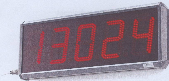
modèle RD 125