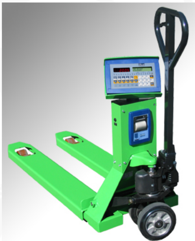
TPWE avec imprimante en option

Transpalette avec module de pesage électronique multi-échelle et terminal de saisie des données intégré, idéal quand il faut gérer les données du matériel pesé; particulièrement indiqué pour les applications de formulation, compteur des pièces, totalisateur, mémorisation des mouvements de l'entrepôt, lecture des codes bare, impressions, étiquetage, ecc. La vaste gamme d'interfaces et de logiciels d'applications disponibles font de cet instrument une réelle station mobile de pesage intégrée au système informatique de l'entreprise. C'est disponible également pour usage réglementé en version CE-M.