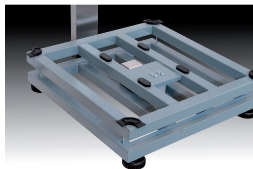
Détail de la structure entièrement réalisée en acier AISI 304